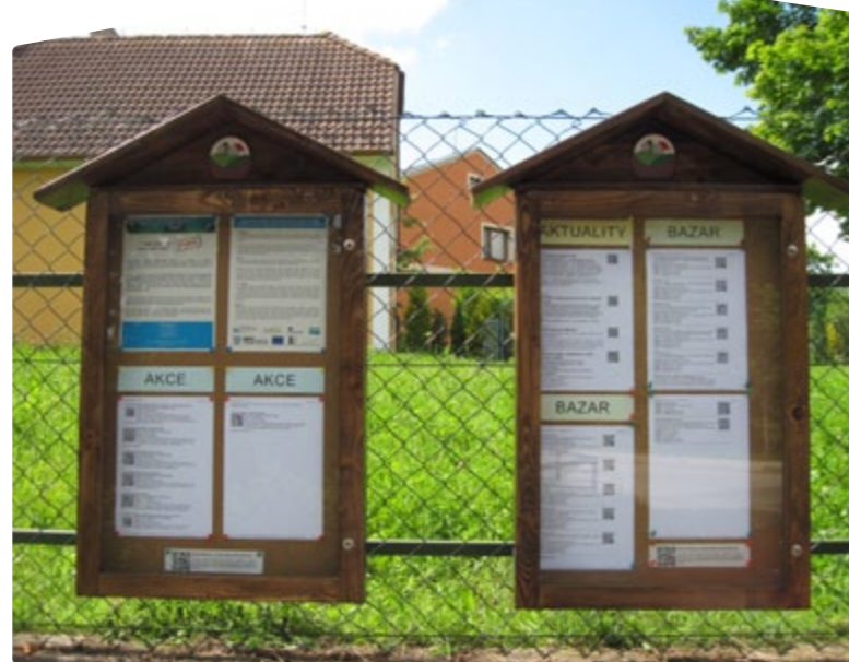
Ukázka vitrín v obci Bohunice.

Pro méně zdatné internetové návštěvníky jsou k dispozici vitríny umístěné v obcích Bohunice, Dolní Bukovsko, Chrástany, Neznašov, Temelín a Žimutice. Ve vitríně je vymezena plocha na umístění inzerátů a také schránka na sběr inzertů, které budou následně vyvěšeny ve vitríně i na webových stránkách Venkovské tržnice.