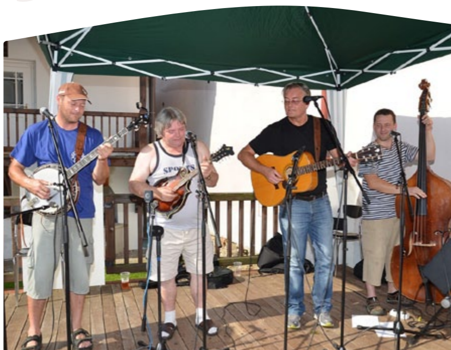
Oblíbená kapela Klídek zahraje i na letošních letních trzích.