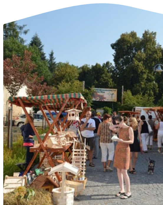
Farmářské trhy jsou vyhledávanou akcí.

* případné změny termínů se dozvíte na webových stránkách www.vltavotynsko.cz/aktuality/