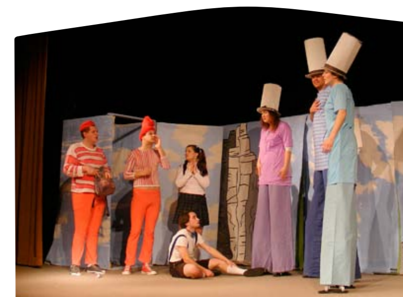
Pohádka Edudant a Francimor

Na závěr nezbyvá, než popřát týnským ochotníkům i další úspěšné roky jejich činnosti, ať už je to na otáčivém hledišti, v Zámeckém divadle či kdekoli jinde. A to tak, jak si mezi sebou divadelníci obvykle přejí: „Zlomte vaz!“