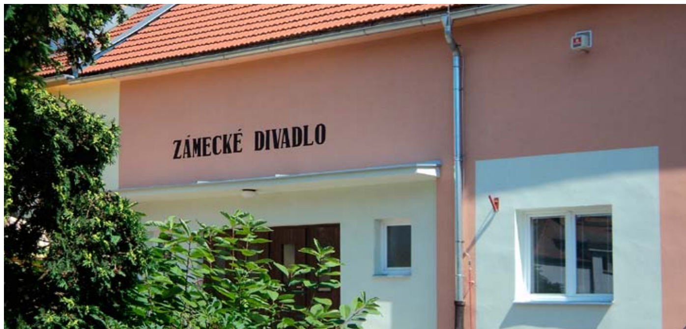
Rekonstrukce Zámeckého divadla